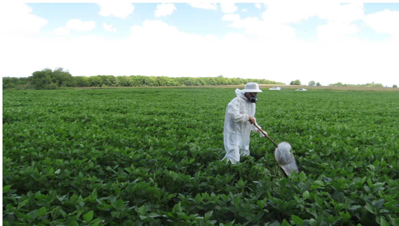
Figura 1. Capturas de artrópodos en canopia de cultivo con red entomológica.