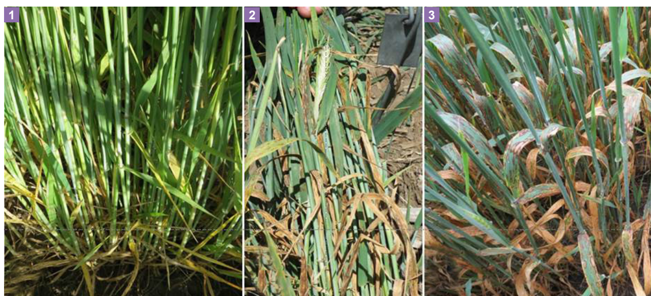
Figura 1. Escala de tres valores utilizada para la caracterización fenotípica de la población objetivo y sus parentales.

Las 158 líneas endocriadas y sus genotipos parentales Andreia y Shakira fueron evaluados bajo condiciones de campo durante la campaña 2014 en las localidades de Bordenave (S 37° 45' 39.78" O 63° 03' 39.70"), Coronel Suárez (S 37°