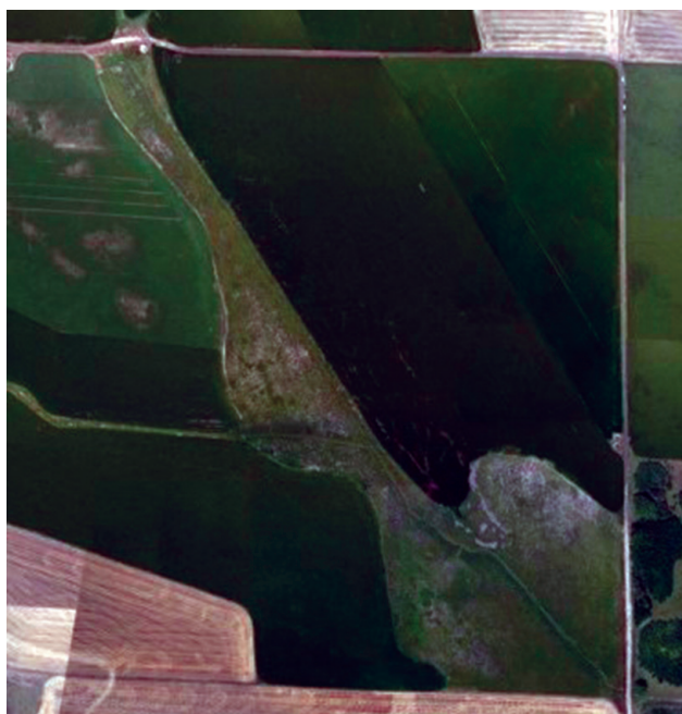
Figura 1. Agricultura de precisión en el establecimiento rural.